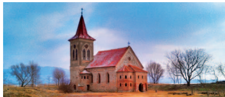
Hodně mrzlo a mušovská jezera na jihu Moravy bezpečně zamrzla. Po skončení vysílací směny jsme se přemístili k malému výletu po ledě a přešli jezero až na ostrůvek ke kostelu dnes už zatopené vesnice. Kousek od břehu v zamrzlém rákosí Aleš mezitím připravil stánek s teplým občerstvením a dohled nad námi měl hastrman Pavel Surý. Zatímco tým byl v kostele, mohl Aleš spočítat hejno migrujících divokých husí na obloze... prý asi 2000 ks – a pod nimi opravdu majestátně kroužil orel mořský.