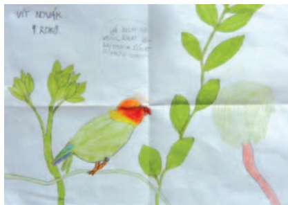
Pořad Kormidlo je občas obohacen dětským uměleckým dílem. Nově připravujeme sérii věnovanou biblickým řemeslům. Vysíláme v neděli ve 12:30.

Mediační partner TWR-CZ: ŽIVOT VÍRY www.zivotviry.cz