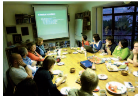
Pracovní předvánoční porada moderátorů R7. Všichni jsou seznámeni s mottem vánočního vysílání – to poslední znělo „Stoprocentní Vánoce“.