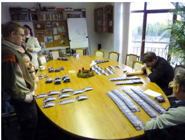
Rozdělování magnetických PF s týmem TWR-CZ. Máte magnetku na lednici? Kuriózní umístění magnetky u vás doma nám můžete vyfotografovat a poslat. Ty netradiční odměníme. Pokud magnetku nemáte, napište si o ni, ještě ji můžeme poslat.