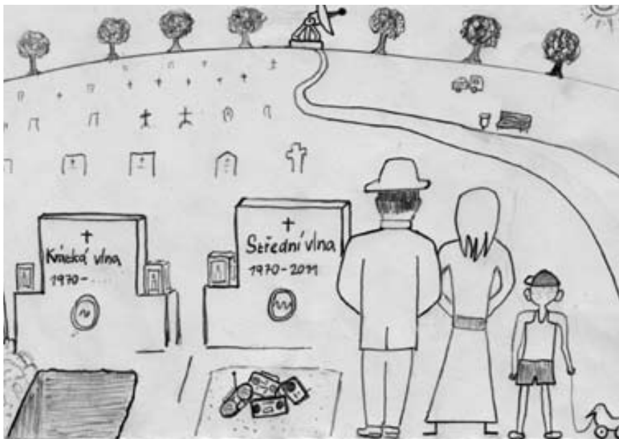
Obrázek nakreslil Štěpán Exner.

naše, ale nejvyššího vedení TWR-International. Takové kroky nikdy není snadné udělat, protože je to pro mnohé posluchače ztráta.