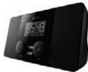
internetové rádio zalip

Kromě příjmu internetových stanic Zalip MAA502 funguje i jako běžný FM radiopřijímač (včetně systému RDS), může tedy nahradit obyčejné rádio.