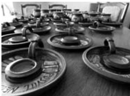
Ručně dělané hrníčky a svícný se sloganem a logem Rádia 7. Dar od věřících ze sboru AC Prostějov.