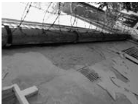
Odlupování vrchní barvy na celém domě má jinou příčinu.

jak jste asi maličké opravy zanedbávali. Moc tomu nerozumím, ale doma by si toto nikdo na vlastním majetku nedovolil. Promiňte mi tento úsudek. Ve vnitřku zatím nebylo žádné chátrání vidět. Je to smutný obrázek asi toho, že - jak říká p. prezident Klaus - peníze jsou ve všem až na 1. místě. Bylo se tam podívat mnoho posluchačů. Zajímalo by mě, zda si tohoto smutného stavu opršelé budovy také někdo všiml. Dejte to vědět posluchačům znovu a znovu i z vysílání, nejen v Anténě. Málokdo si dnes sedne a čte. Raději poslechně.