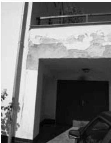
Voda prosakující přes dlažbu do bočních zdí poškodila v zimě fasádu.

Do vysílání pořadu Kudy kam na téma „Podstatné a nepodstatné“ přišla tato reakce: