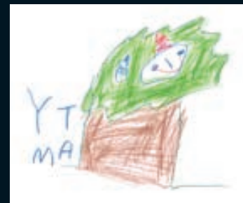
Matyáš Fuksa: Duboví skřítki v koruně dubu Eliška Tonarová: Duboví skřítki ve větvích